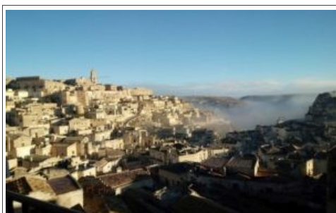
Matera capitale europea della Cultura 2019

Inizia la gran festa di Matera capitale europea della Cultura e la Fondazione Matera 2019 dà i numeri